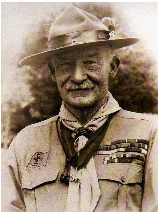
Robert Baden Powell - zakladatel skautingu

Junák - český skaut, z. s. je největší výchovnou organizací v republice a je zároveň členem světových skautských organizací WOSM a WAGGGS.